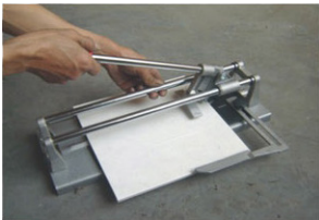
Ajuste la guía al ancho de la cerámica

TIP: al presionar el mango con una mano sostenga el azulejo donde comenzó a marcar con la otra mano