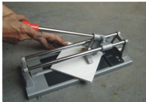
Coloque la baldosa en el hueco para cortar los ángulos de 45°